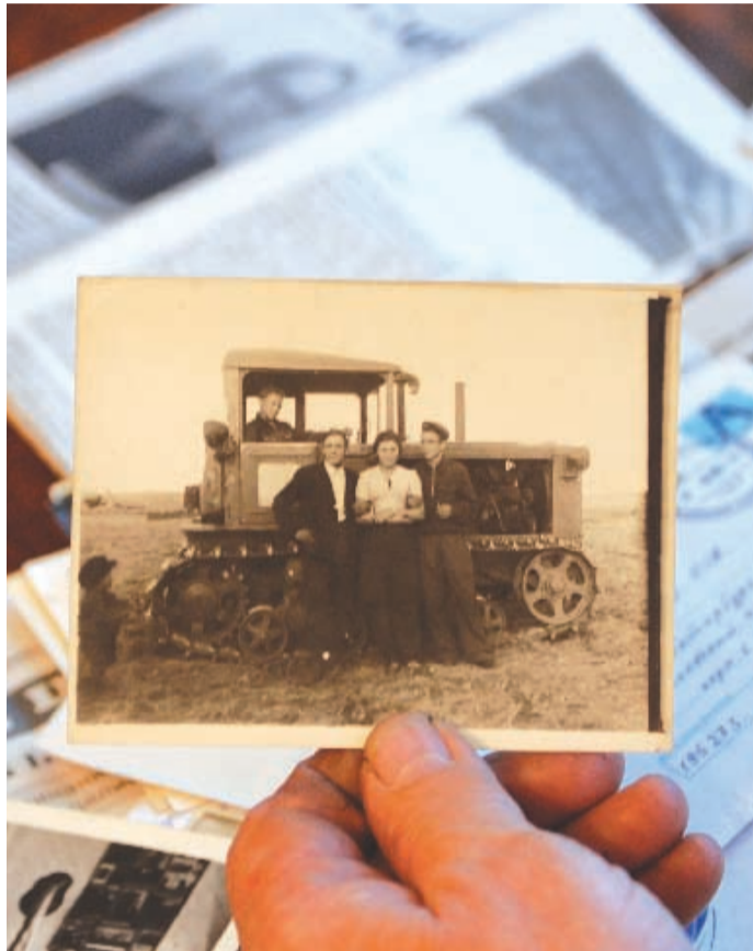
Вот так и выглядела романтика – в чистом поле только ветер, трактор и вечная молодость.

Всего я пробыл на целине три с половиной года – строил ожегитие и коровник, рубил камень, был трактористом